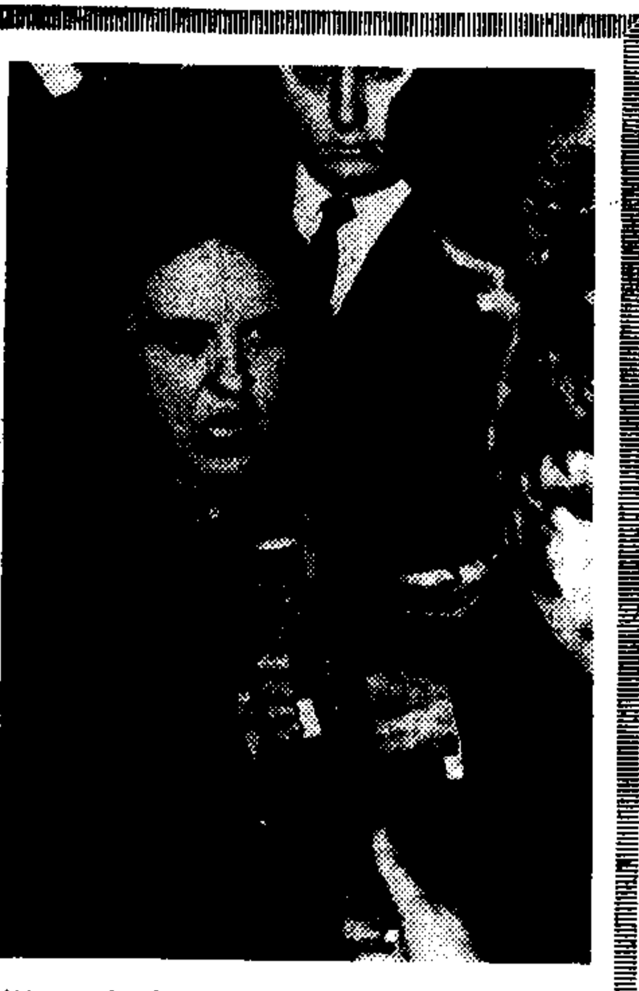
Η μεριά του θέματος, αλλά. Εννοείται Μπράντ...