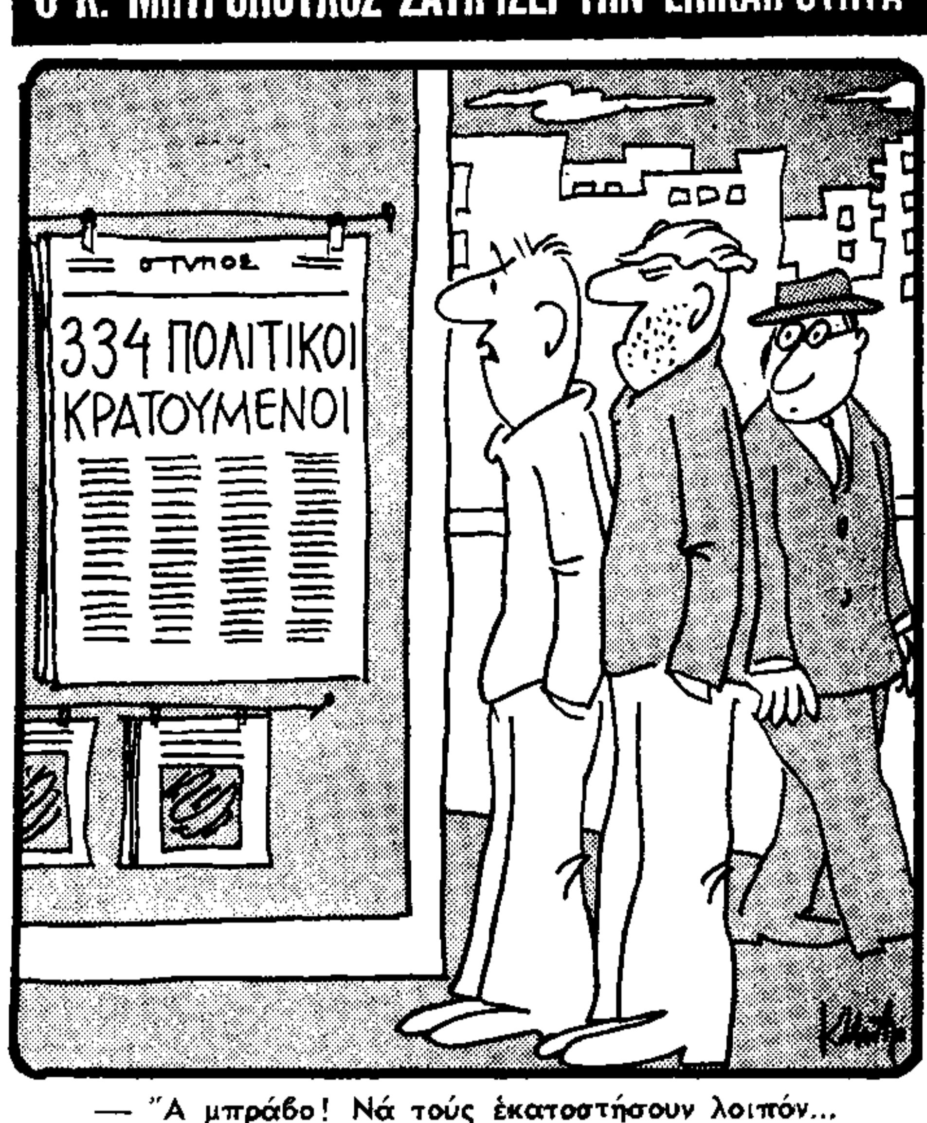
— Α μπράβο! Νά τους εκατοστήσουν λοιπόν...