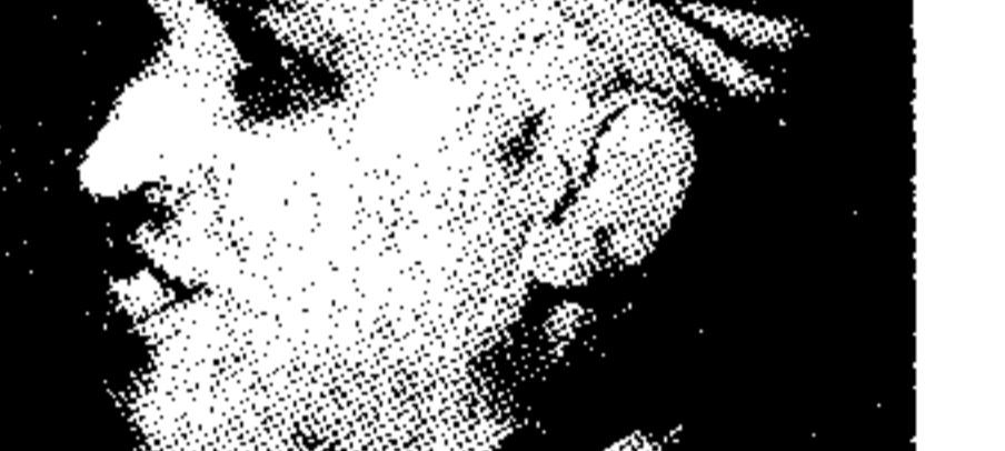
Ο Τοντάρ Ζίβκωφ