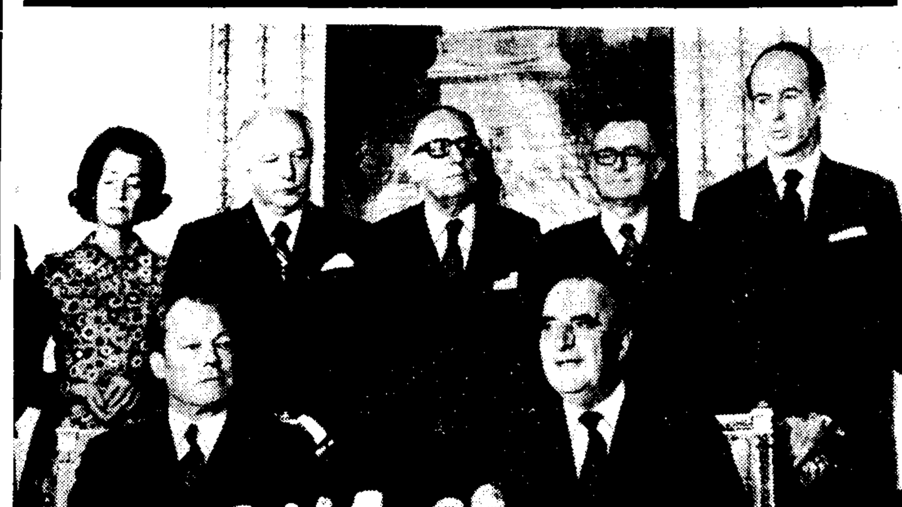
Τερματίσθηκαν στο Παρίσι με γενική σύμφωνη γνώμη, εκτός από ορισμένα ειδικά προβλήματα, οι συνομιλίες του Γαλλικού προέδρου κ. Ποπιντιού και του Γερμανού καγκελάριου κ. Βίλλυ Μπραντ...